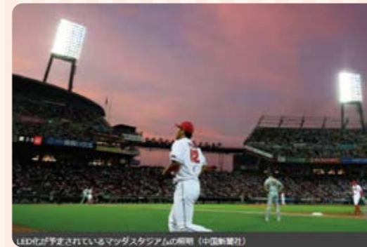
『マツスタ、まだLEDではなかったのね』と言う声聞かれますね。(中国新聞デジタルより)

マツダスタジアムもいよいよ照明の全面改修が始まります!(2025年春までに改修)