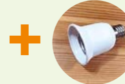
変換アダプター (2個入り 580円)