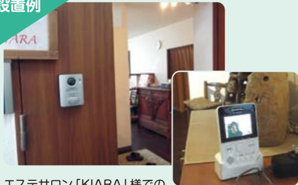
エステサロン「KIARA」様でのワイヤレスインターホン(配線工事は必要ありません)

自動録画機能付きのインターホンの交換の場合、工事費込み(配線工事費含む)でおおよそ、4万円~5万円くらいです。大画面、高画質の物や2階でも来客の確認が出来る追加の子機などがある場合は、金額は変わってきます。