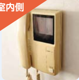
受話器式・色も変色しています