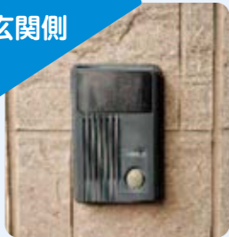
15年以上前の玄関子機