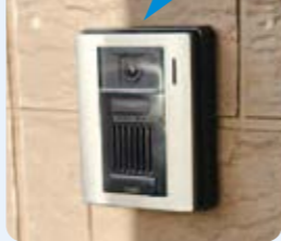
新しいカメラ付きの玄関子機