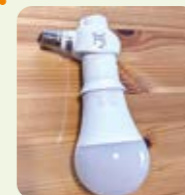
E26LED電球60W (4個入り 1,399円)

E17よりもE26の60Wの方がより明るいので口金が変わる変換アダプターも付けてみました。 変換アダプター + 変換アダプター + 60W電球E26サイズのLED電球でより明るい我が家となりました。