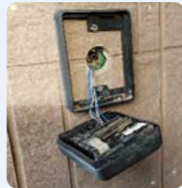
一目で古いとわかります