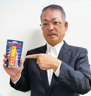
催涙ガスのように見えますが防犯笛です

知識として持っていて、なかなか行動までには至らない方が多いという事です。何故でしょうか？危機感がないから？身近に感じていないから？お金がかかるから？講座が終わるやいなや「いい話を聞いたよ。明日には相談の電話を掛けるから」と言われていた方からも、ほとんど電話がかかって来ません。何かいい知恵をお持ちの方はメールでもFAXでもお寄せいただくとありがたいです。ご意見をいただいた方の中から抽選で「 高圧ガス式の防犯笛 」ALARM115をプレゼントします。