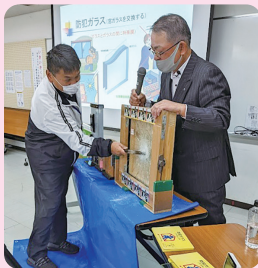
ガラス割り実験 (大河公民館)