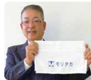
社名入りで使いくいかも知れませんが…