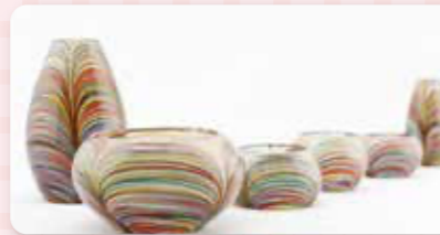
最近のモダンなお仏具とおりん

防犯関係(セキュリティ)も一緒に「何からどうしたらいいのかわからない」と思いますので、メールでもお電話でもお気軽にご相談ください。