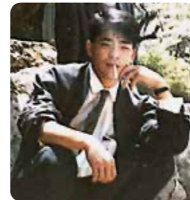
若いころは吸ってましたね

令和2年は世界中全体が大変な年でしたが、今年こそは皆さまにとって佳き年となりますよう祈念いたします。健康第一で今年を乗り切って参りましょう。