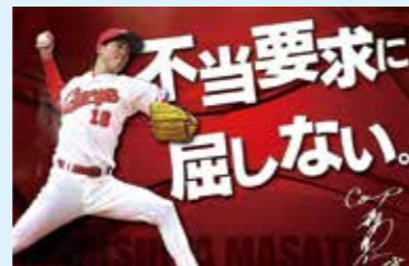
味方の拙攻にも屈しないで頑張り-

さて、当社は今年の9月で創業50周年を迎えます。カープのスローガンのように派手ではありませんが、「GoTo 50周年」を掲げて今年一年を頑張っていますので、変わらぬお付き合いをお願いいたします。