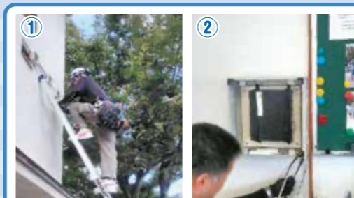
まずは配線工事から進めていきます。