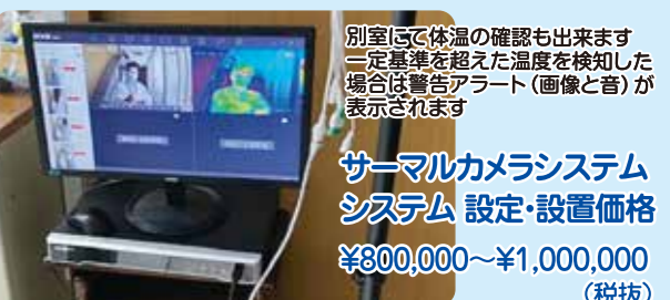
別室にて体温の確認も出来ます 一定基準を超えた温度を検知した場合は警告アラート(画像と音)が表示されます

サーマルカメラシステム システム 設定・設置価格 ¥800,000~¥1,000,000 (税抜)