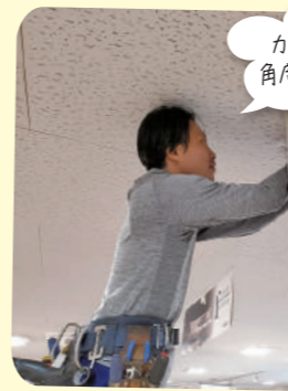
カメラの設置 角度は重要です

生年月日 1981年5月13日 出身地 広島市安芸区中野東 趣味 ラーメン屋巡り(今は鶏白湯ラーメン「かけはし」にハマってます) 好きな食べ物 加奈子亭(家族の為に作ってくれる奥さんの料理が一番美味しい)