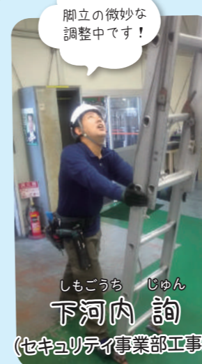
脚立の微妙な 調整中です！

●近所との温かい交流があります。 瀬野川の河川敷はウォーキングに最適で冬には多くの渡り鳥が見られます。