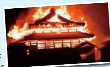
首里城炎上は衝撃的でした

さて、去年の各種災害の教訓として台風対策は難しいですが、初期消火が間に合わなかった首里城炎上に関しては予防対策をお勧めできるものがあります。それは建物全体に煙が蔓延してから感知する煙感知センサーではなく、7cmの炎を10m先で感知できる炎センサーです。