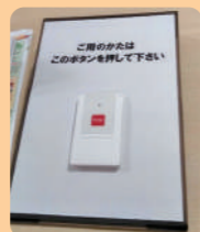
押しボタン式 チャイムは意外と 便利