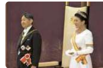
両陛下もお健やかでいらして欲しいですね