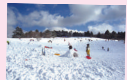
冬も楽しいもみの木森林公園

株式会社 通話料 0120-1269-24 nakashima@moritaka.jp モリタカ FAX 082-581-5539 携帯電話のカメラでこちらのQRコードを取り込むと便利です。→