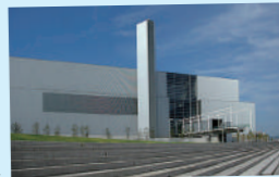
ゴミ焼却場と思えない！

ごみ焼却施設とは思えない近代的な建築物で最新鋭の焼却装置があります。建物の中央は「エコリウム」という貫通路が通っていて、銀色の配管を見ながら通路を抜けると正面には海が見えます。ぜひ見学してみてください。ゴミ焼却場と思えない！