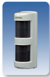
パッシブセンサー ¥40,000(税抜)