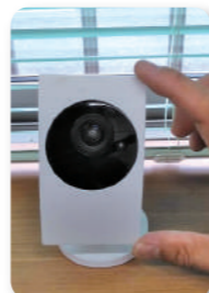
威圧感を与えない ネットワークカメラ ¥46,000(税抜)