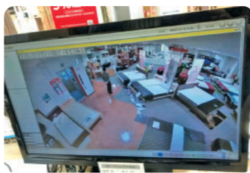
エレベーター前に人の気配があるのがわかります

カメラは防犯目的だけでなく、店舗内でのお客様の誘導をスムーズにサポートしてくれます。