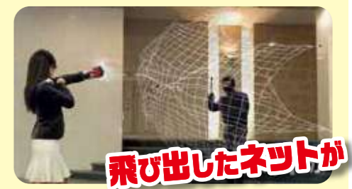
飛び出したネットが

ネット発射部分は簡単に交換ができるカートリッジ式。グリップ部分が繰り返し使用可能で経済的です。ネットを発射すると警報ブザーが鳴り、電池を外すまで止まりません。そして周囲に異常を知らせてくれます。