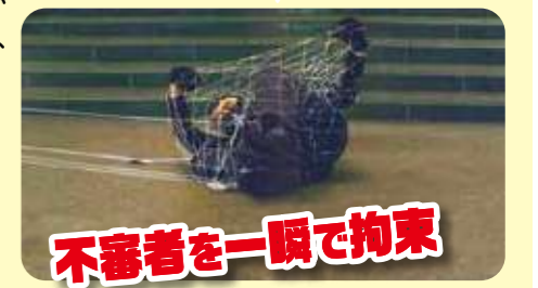
不審者を一瞬で拘束