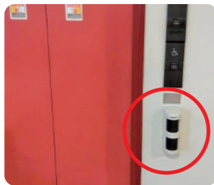
パッシブセンサーで人の動きを検知