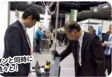
10時オープンと同時に来場者が続々と!

令和元年11月広島グリーンアリーナで、広島4信用金庫の合同ビジネスフェアが開催されモリタカも今回で10回目の出展です。来場者も1万人を超え、モリタカのブースにも商談・相談依頼があり、たくさんの方にお集まりいただきました。