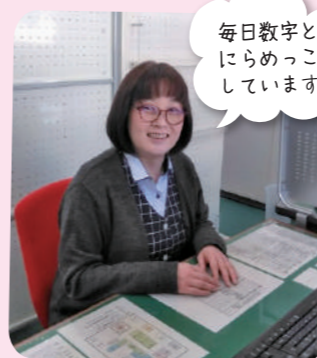
毎日数字と にらめっこ しています

生年月日 1900年4月30日 出身地 広島県廿日市市 趣味 音楽・DVD鑑賞(映画やドラマなど20年以上) 好きな食べ物 イタリアン、お好み焼き、鉄板焼き お店を出している友人が多く、時々食べに行っはついつい食べ過ぎてしまうのが悩み(体重が...) おススメの店 ●ゾーナイタリア ●カノーバカノーバ(イタリア料理) ●えん 駅西(お好み焼き) 広島赤鷲の鉄板焼きは一度食べたらやみつき間違いなし。 ●常太郎(お好み焼き) 壁一面のサインがすごい