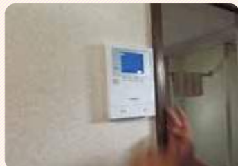
新しいモニターの取付