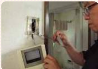
室内側古いモニターの取外し