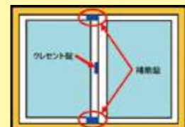
補助錠や防犯シートを貼る