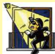
センサーライトで威嚇

簡単に出来る防犯対策としては、住民間のコミュニケーションを減らすこと。顔を見て挨拶することを徹底するだけで不審者にとっては侵入しにくい環境となるのです。 *住民間のコミュニケーションが希薄であることが、泥棒にとっては犯罪をおこしやすい環境になっている。