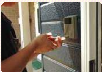
玄関側の古い子機の取外し