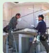
山下・日向 (学校の防犯工事)

今年の夏も、カメラ工事・防犯工事・電気工事と様々なご依頼をいただき、大変忙しくさせていただきました。