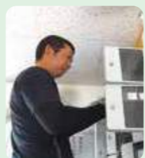
木村 (学校の防犯工事)