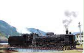
向きを変えている所(すぐ近くで見れます)