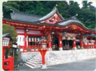
津和野稲荷神社(商売の神様)