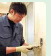
池田 (スイッチ交換工事)

腕の良い職人達がいるので、防犯、あるいは電気工事のご依頼、ご相談は、モリタカまで。お電話・FAX・メールにてお受け致します。