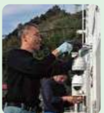
秋島・日向 (カメラ工事)