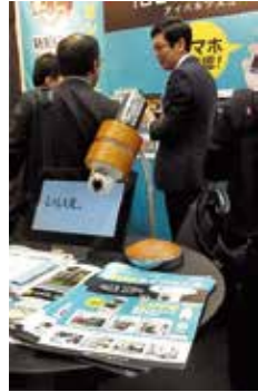
電気スタンドに取り付