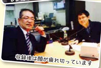
収録後は顔が疲れ切っています