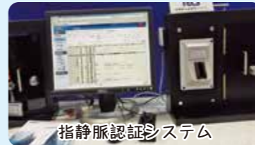
指静脈認証システム