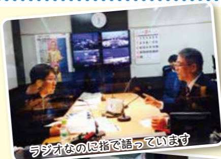
ラジオなのに指で話しています