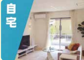
自宅 長期旅行などで不在時の 様子をいつでも見守り