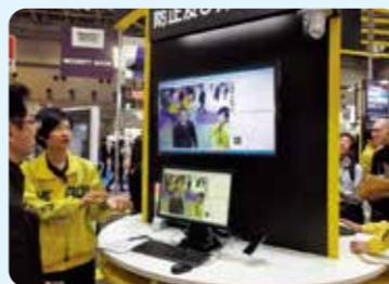
顔認証システムのブース

※顔認証による検知は、万引き犯と断定する製品ではありません。今や万引き被害額(年間)は、4,600億円超という驚きの実態!被害の状況を打破できないまま、倒産に追い込まれるケースも多数存在します。そして、繰り返される万引き被害に、最新の防犯カメラシステムの導入が取り入れられるようになってきました。