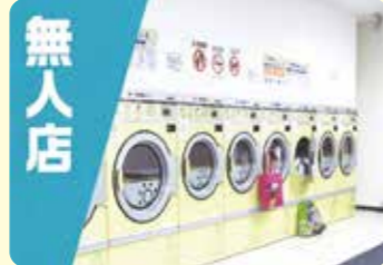
無人店 店員がいない無人店でも 店員の目となって監視

防犯だけでなく、介護用のカメラとして大切な家族を見守ったり、ペットの留守番をチェックしたりと様々な用途に使えそうですね。