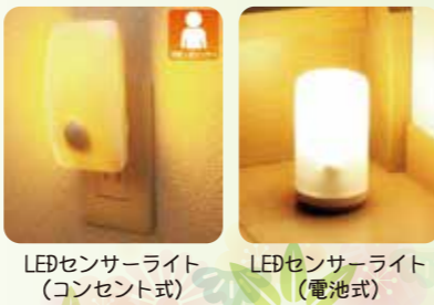
LEDセンサーライト (コンセント式) LEDセンサーライト (電池式)

お話を伺っている中で、こんなご質問がありました。「玄関に入った時に自動で点灯するライトがないかしら？」最近ではコンセントに差し込むだけで、暗闇で人に反応し自動点灯するLEDライトがあります。(写真左)他に、電池式(写真右)もあり種類も豊富です。値段は¥2,000～¥5,000位です。