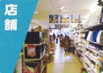
店舗 気になる場所に取り付けて 店内の状況を確認