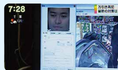
要注意人物の画像を登録