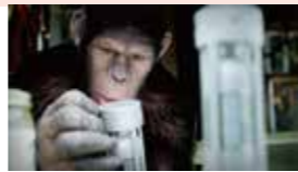
類い稀な知性を持つシーザー

50代、60代の方で、「猿の惑星」と言えば “自由の女神”のラストシーン が印象に残っているのでは? 第1作目から48年目、「ジェネシス」は、まさしく現代版「猿の惑星」! CGを駆使し、子どもから大人まで楽しめる映画だと思えます。シーザーが成長するに従い、言葉がない分、苦悩や葛藤が伝わってきます。何かを決意した時や考へてる時のシーザーの眼が良いですね。続編の「ライジング」も見ましたが、私は「ジェネシス」の方が、良かったかな〜と思いましたね。「猿の惑星」の起源に迫る作品です。ぜひご覧になってみてください。