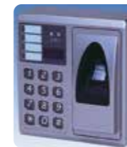
最新の指紋錠本体の定価 ¥150,000

指でワンタッチするだけでカギが開きますので、荷物をいっぱい持っている時でも容易に開けることができます。一緒にいる人に暗証番号やカギ番号を見られることもなくカギを盗まれることもないので安心です。ピッキングは不可能です。