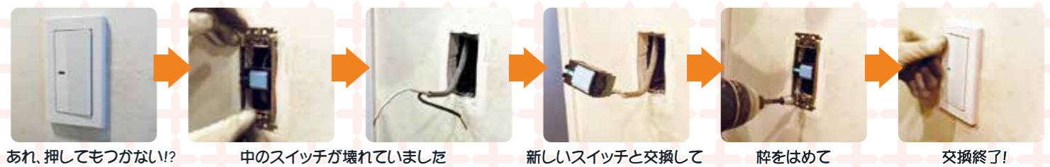
あれ、押してもつかない!?

我が家(見玉家)は築11年目。使用頻度の多い頃にスイッチも壊れていきます。今回脱衣所のスイッチが壊れたので新しいスイッチへ交換工事を行いました。