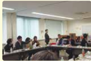
全顧客身内化実践会会議の様子