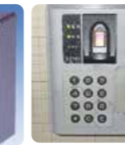
某会社入口の指紋錠

ただし、指が乾燥している・ふやけている場合や、お年寄りなどは指紋がはっきりしない時もあり認証は難しくなります。その場合は暗証番号の照合方法を併用しておけば安心です。