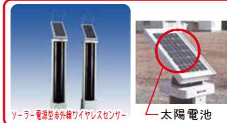
ソーラー電源型赤外線ワイヤレスセンサー