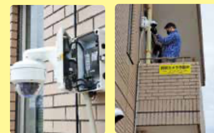
▲屋外にそのまま設置ができる録画器一体型のカメラです

にもなりますし、事件や事故の抑止効果もあると思われます。 そうした中、 広島市の【藤の木町内会】の方々は【藤の木公民館】さんの協力のもと、防犯カメラの設置が実現しました。 現代のような車社会においては、歩行者も運転者もそれぞれの責任を自覚して、周りの人に迷惑を掛けず、安全、快適に通行するように心掛けなければなりません。夜だからこんなところに人はいないだろう、車は来ないだろうと思い込んで安全確認を怠らないようにしましょう。これは 防犯対策も一緒 です。 自分の家だけは狙われないだろう、何も取られるものはないから大丈夫、などと「油断や思い込み」が無施錠に繋がって空き巣に狙われることとなります。 財産だけでなく、自分や家族の命を守るために危機管理意識を持ちましょう。そして、「藤の木学区安全・安心協議会」では今後、公園内など防犯カメラを増やし安全・安心なまちづくりに取り組んでいかれるとの事ですので、その時もまたご協力させていただきます。