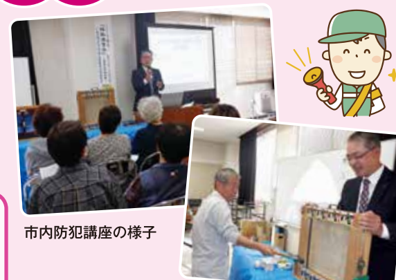
市内防犯講座の様子

♪ 愛することに～疲れたみたい～ 嫌いになった訳じゃな～い～♪ ♪ 部屋の灯りは付けておくわ～ 鍵はいつもの下駄箱の中～♪ 「下駄箱の中にカギはマズイでしょう」という話しなどを交えて、防犯の専門家として心構えから具体的な対策を侵入窃盗だけでなく詐欺にも遭わないように楽しく話をします。