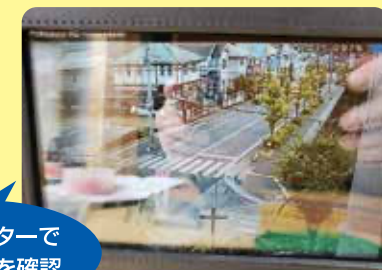
調整モニターで録画範囲を確認