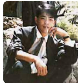
若いころは吸ってましたね

令和2年は世界中全体が大変な年でしたが、今年こそは皆さまにとって佳き年となりますよう祈念いたします。健康第一で今年を乗り切って参りましょう。