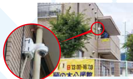
▲まったく明かりのないところでも録画できるカメラです

～『広島市 藤の木学区安全・安心協議会』はこの度「町内会防犯カメラ」を設置しました～