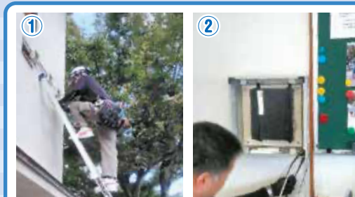
まずは配線工事から進めていきます。