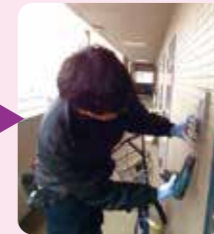
外側インターホン工事