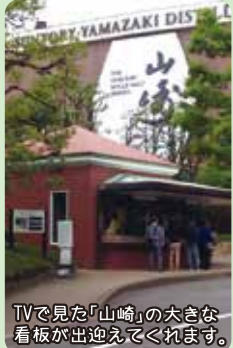
TVで見た「山崎」の大きな看板が出迎えてくれます。