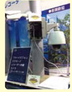
SDカード内蔵カメラ

町内会や防犯組合連合会などが公園や交差点などの公共空間に事件・事故などが起きた時の画像検証を目的として設置するものです。その設置にあたってのネックは、 ①初期費用負担 ②ランニングコスト負担 ③映像記録装置の保管場所 ④映像を記録した媒体の管理・運用 などでした。