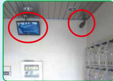
エントランス内にカメラとモニター