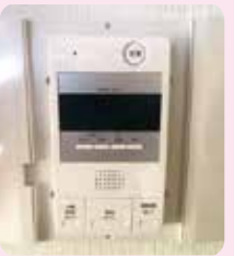
リニューアル後の 室内器

最近では、インターホンやオートロックは標準装備になってきました。入居者が安心して暮らせるのが一番ですね。あなたのマンションのインターホンは壊れていませんか?