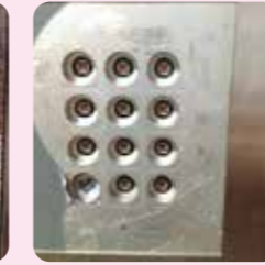
インターホンが付いていても このようなマンションには 絶対住みたくないですね。