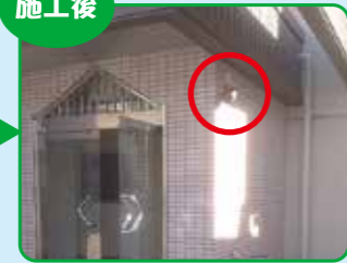
入り口に取り付けた防犯カメラ。ゴミ置き場もしっかり監視します。