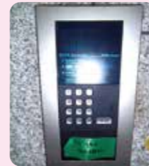
集合玄関機の リニューアル前