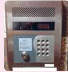
剥ぎ取られた ボタンカバー

賃貸マンションを選ぶ際に安全面で重視するのは防犯カメラ、インターホン、オートロックではないでしょうか。家賃を考えると防犯カメラのある物件は難しいかもしれませんが、せめてインターホンかオートロックのある物件にしたいと思われる方は多いと思います。