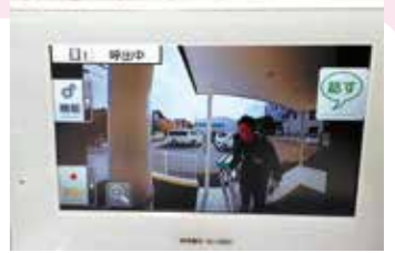
最近のモニターは タッチパネル式で誰でも 簡単に操作できます

一人暮らしで安全面を重視される女性には必須とも言える設備です。もしも一人暮らしの女性を狙った犯罪が起ると、後の入居率にも影響を与えてしまいますので、セキュリティが重視される昨今、モニター付きインターホンは入居者へのアピールにもなり空室対策にはもってこいの設備ではないでしょうか。