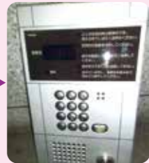
リニューアル後の 集合玄関機