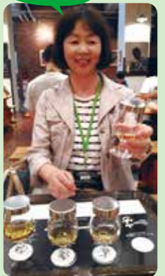
4種類のウイスキーをテイasting