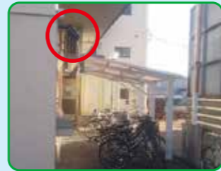
駐輪場側に1台カメラ