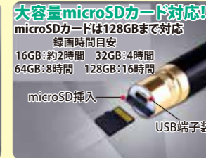
大容量microSDカード対応! microSDカードは128GBまで対応 録画時間目安 16GB:約2時間 32GB:4時間 64GB:8時間 128GB:16時間 microSD挿入 USB端子装備