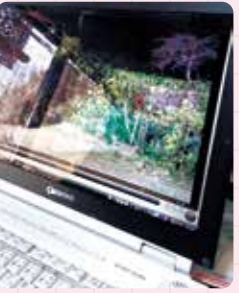
接続ケーブルを繋げて 録画した映像をパソコンで確認

録画設定によって撮影時間は異なりますが、付属の16GBのSDカードで録画の場合、約2時間録画できます。古い画像から上書きされていきます。最大128GBのSDカードで16時間の録画が可能です。もちろん、ボールペンとしての書きやすさもバッチリです!