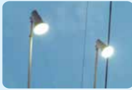
市内スーパーの投光器

熊本県で起きた水俣病、発生から60年経った今でも患者数は5,000名を超えています。同様の事件は世界各地で起きており、そうしたことから2020年以降は水銀が規制されることになりました。