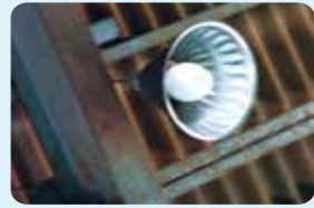
市内工場の水銀灯

2020年以降「水俣条 約」で水銀の製造・輸 入・輸出が禁止に! ※一部規制対象外