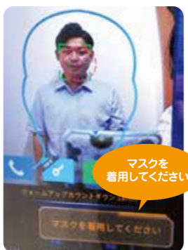
マスクをしていないと「マスクを着用してください」と音声で知らせます。