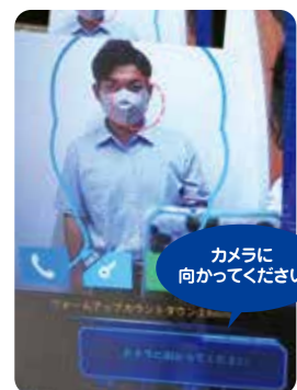
画面の前に立つと「カメラに向かってください」と音声で促します。

体から出る赤外線と周辺の気温を人工知能(AI)が比較して体温を算出し、リアルタイムで表示します。登録した人物は、顔がマスクで隠れていても目の間隔や顔の輪郭などで判別します。体温と出退社時間も記録させることができます。