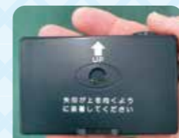
手のひらサイズの「倒れコール」 倒れコール ¥59,800(税抜き)

コロナ禍により今年の夏はマスクをしたままの作業をされる人が多く見られます。急に倒れたり、緊急事態が起こって助けを呼ぶことが出来ないときに、この『倒れコール』は人の転倒と同時に大音量の警報音で周囲に知らせます。押しボタン機能もあり、緊急コールもできます。