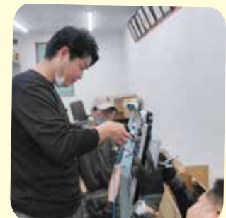
先輩の指導を受けながら機器の組み立て