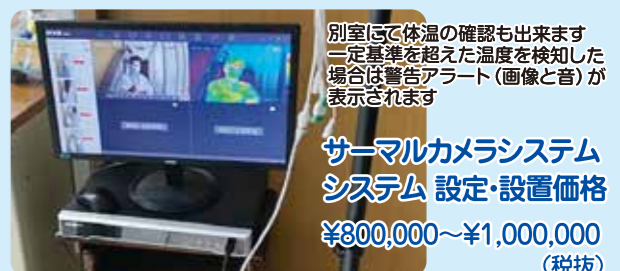
別室にて体温の確認も出来ます。一定基準を超えた温度を検知した場合は警告アラート(画像と音)が表示されます。

サーマルカメラシステム システム 設定・設置価格 ¥800,000~¥1,000,000 (税抜)