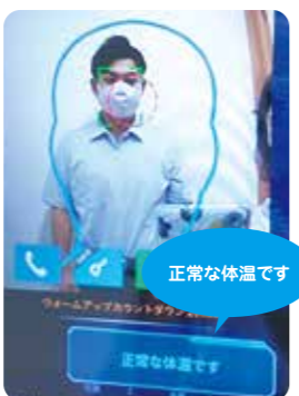
正常であれば「正常な体温です」と音声で知らせます。