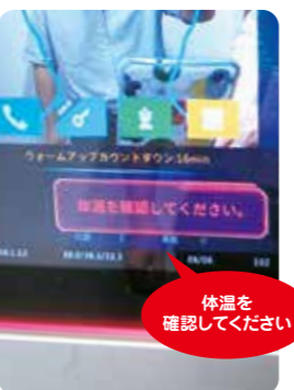
適正な体温でない時は「体温を確認してください」と音声と赤いランプで知らせてくれます。