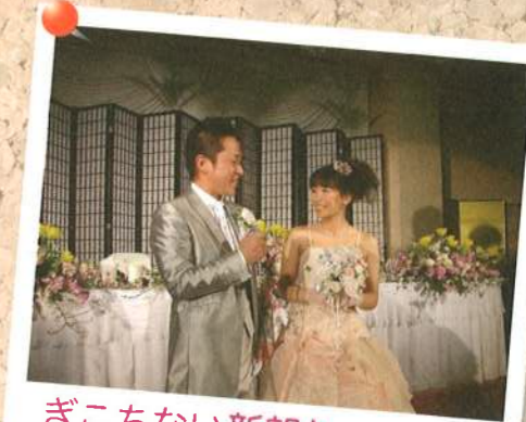
ぎこちない新郎と 笑顔満開の新婦