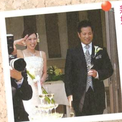
尾中編集長の号令で 新婦も敬礼

この会社に勤めることがきっかけになって、そしてこの会社で自分と家族の今後を考える…。また少し荷物が重くなった様な気もしますが、益々頑張れそうな気がします。ただ、スピーチの内容を2通り考えることと、祝儀が一遍に…が辛かったですけどね(苦笑)