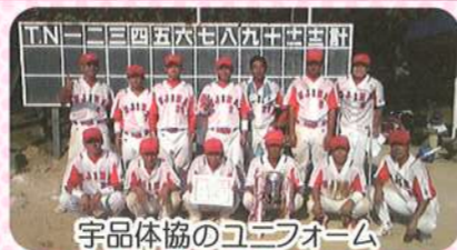
宇品体協のユニフォーム